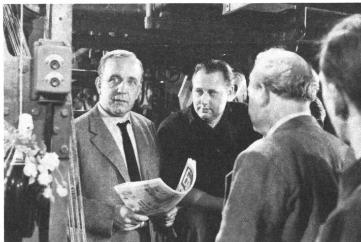
Er geht der Sache nach und entdeckt schließlich den wahren Schuldigen.