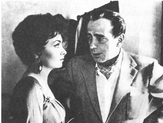
Bogart als gewitzter Vermittler und als Mann der Lollobrigida im Film «Stärker als der Teufel». Gegenüber dem ausgezeichneten Spiel der andern vermag sie aber nicht aufzukommen.

ms. John Huston, der Schöpfer von «Der Schatz der Sierra Madre», «Die rote Flagge des Mutes», «Asphalt Dschungel», «Moulin Rouge» und «African Queen» hat diesen Film vor drei Jahren geschaffen, und erst jetzt ist er in die Schweiz gekommen. Ein Film, der in ein Studiotheater gehörte, die freilich, bedenkt man, daß sie an seiner Stelle «Papa, maman, ma femme et moi» und Ähnliches vorführen, den Mumm zum Wagnis verloren haben. Um so erfreulicher, daß ein Großtheater in Zürich den Mut aufgebracht hat, diesen absonderlichen,