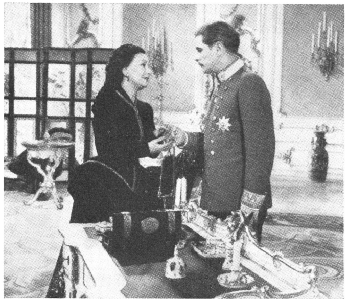
Kronprinz Rudolf und seine Mutter, die Kaiserin Elisabeth. Die Wirklichkeit war allerdings anders.

poetisch-verzauberte Drama der unglücklichen Liebe des Kaisersohnes und der lieblichen Gräfin gestaltet. Später wurde die Rolle des Prinzen von Jean Marais in einem opulenten Melodrama gespielt. In diesem Film nun, der zwischen der Poesie Litvaks und dem Melos des späteren Franzosenfilms ungefähr die Mitte hält (freilich etwas mehr nach dem Melos neigt), spielt Rudolf Prack Ihre Hoheit. Er ist ein etwas steifer Prinz, aber die Christine Hörbiger ist eine liebebreizende Vetsera. Rudolf Jugert hat den Film, der natürlich vom Aufwand und der schönen, fülligen Szenerie lebt, den Hauch der k.k. Zeit heraufbeschwört und nicht frei ist von der österreichischen Nostalgie nach dem Franz-Josef-Zeitalter, mit Geschmack inszeniert und arbeitet wenigstens so, daß er den Freund des guten, das heißt hier des andeutenden, in Zwischen-tönen sich aussagenden Films nicht verärgert.