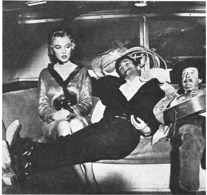
Marilyn Monroe in dem letzten in Venedig außer Konkurrenz gezeigten Film «Bus-stop», einem heitern Wildwester, als gefangene Braut.