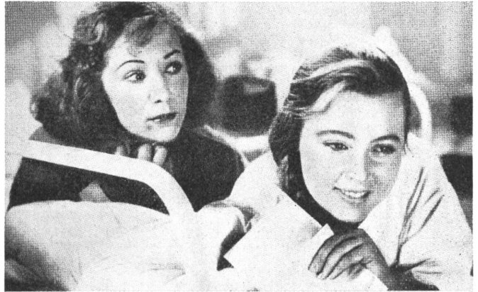
Russische Mädchen aus dem in Karlsbad gezeigten russischen Film «Der Fall Rummyantsew».

weit wird man sie «oben», wo man über Gefängnisse und Henkersknechte verfügt, dulden? Darüber bestand keine Klarheit, und man hatte das Gefühl, auch «oben» nicht (vielleicht nicht einmal «ganz zu allerberst», das heißt in Moskau). Zweifellos konnten jetzt westliche Filme, wie z. B. die beiden italienischen, gezeigt werden, die keinerlei politische Tendenz aufweisen. Ferner sah man einzelne östliche Filme, die man beinahe eher als brav westlich-neorealistisch ansprechen muß. Andererseits ist der (an diesem Ort schon besprochene), ostdeutsche Film «Ernst Thälmann» von Maetzing gezeigt worden, der noch ganz in die Stalin-Periode gehört und dem abgeschafften Persönlichkeitskult in stärkstem Maße fröhnt. Auch die Preisverteilung war bezeichnend; das Festival stand unter dem Motto einer «besseren Freundschaft und Verständigung zwischen den Völkern». Demzufolge bekam der eher schwache Film «Si tous les gars du monde» den Preis, der in fast kindlicher Weise den beteuerten, honigsüßen Absichten des Festivals entspricht. «Marty» überragte ihn und die andern turmhoch, wurde aber beiseite geschoben. Er scheint nur zugelassen worden zu sein, um den Kontrast zwischen der «faulen und satten» Welt des Westens und der pädagogisch optimistischen und auftrumpfenden kommunistischen zu zeigen.