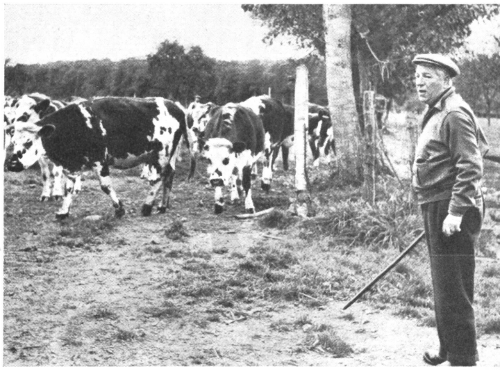
Jean Gabin in seiner liebsten Rolle als Großbauer auf seinem Landgut.