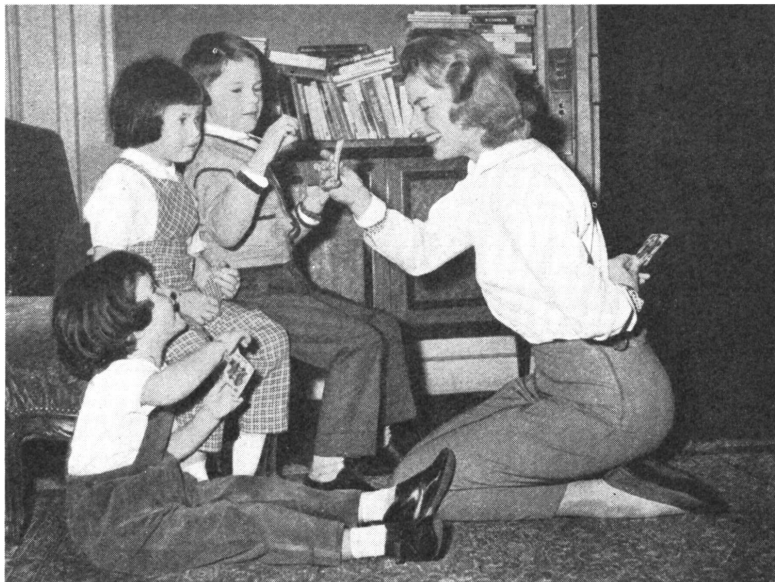
Ingrid Bergmann, zurück von ihrer erfolgreichen Filmarbeit, spielt mit ihren Kindern.