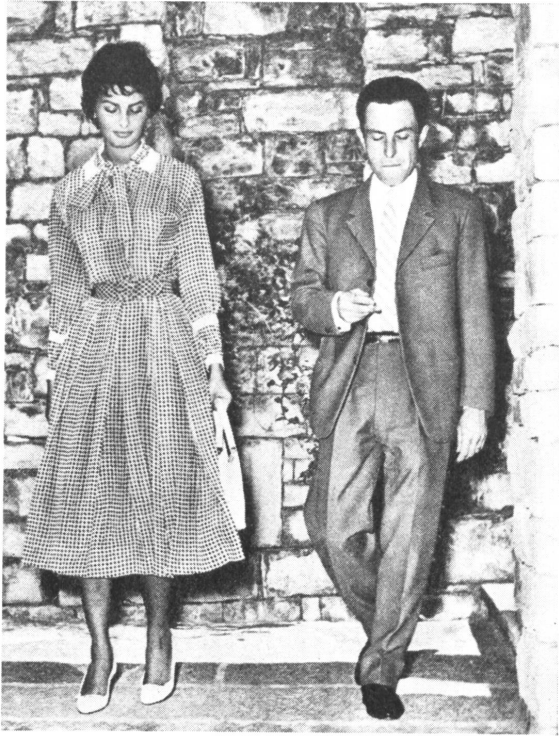
Sofia Loren, vorübergehend aus den USA zurück, in ihrem neuen Heim in Mendrisio, wo sie endgültig Wohnsitz genommen hat. Auch ihre Produktionsgesellschaft hat Domizil in der Schweiz genommen.