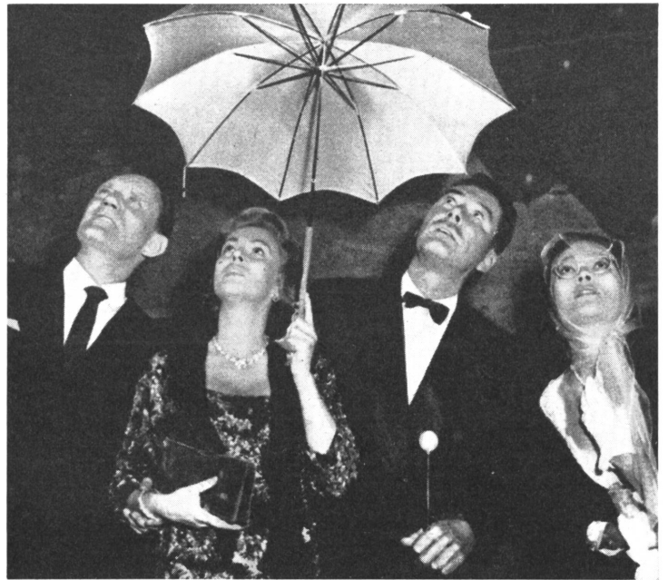
In Berlin regnete es während des Festivals. (Von links nach rechts): Trevor Howard, Nadia Gray, Errol Flynn und Pat Wymore halten besorgt Ausschau.