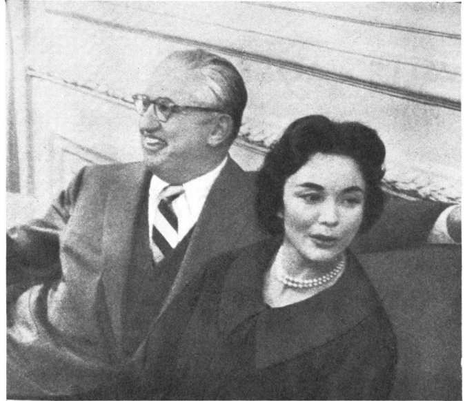
Der Produzent Selznick auf der Reise nach Italien zur Verfilmung von Hemingways Roman «Farewell to the arms» mit seiner Frau Jennifer Jones, welche die Hauptrolle spielen wird.

in Rom nicht verlangen. Allerdings ist eine neue Schwierigkeit aufgetaucht: Die Verwendung von Truppen für Filmzwecke ist von der Regierung infolge von den beim Film «Krieg und Frieden» aufgetauchten Polemiken verboten worden. «Italienische Soldaten sind keine Statisten», erklärte der Verteidigungsminister, der kein besonderer Freund des Films zu sein scheint. Selznick muß sehen, wie er auch diese Schwierigkeit überwindet. Er wird wahrscheinlich eine Armee von Komparsen suchen müssen. Ob die Drohung, er werde allenfalls den Film in Jugoslawien drehen, wenn Italien ihm weiterhin Schwierigkeiten bereite, nützen wird, ist fraglich.