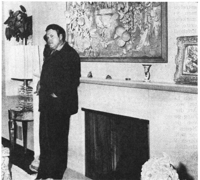
Orson Welles, nach Amerika zurückgekehrt, am Kamin seines neuen Hauses in Hollywood, das er einst unter Verwünschungen verließ.

ZS. Seit acht Jahren hat Orson Welles geschwiegen. Der Wunderknabe des Films, der 1938 mit seiner berühmten Radio-Sendung über einen Einfall der Marsbewohner die amerikanische Bevölkerung in Schrecken versetzte, der mit seinem «Citizen Kane» die Filmindustrie erstaunte und selbst erfahrene Kritiker verblüffte, um dann auch als Schauspieler im «Dritten Mann» eine hervorragende Lei-