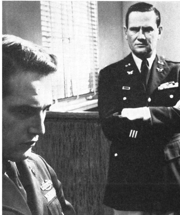
Der Vater des Angeklagten, der sich über seine unbewußte Mitschuld klar geworden ist, sucht ihn während der Verhandlung auf, um ihm beizustehen.

In den Augen der Welt ist er schuldig und die Richter verurteilen ihn, aber Familie und Gemeinschaft sind mitschuldig.