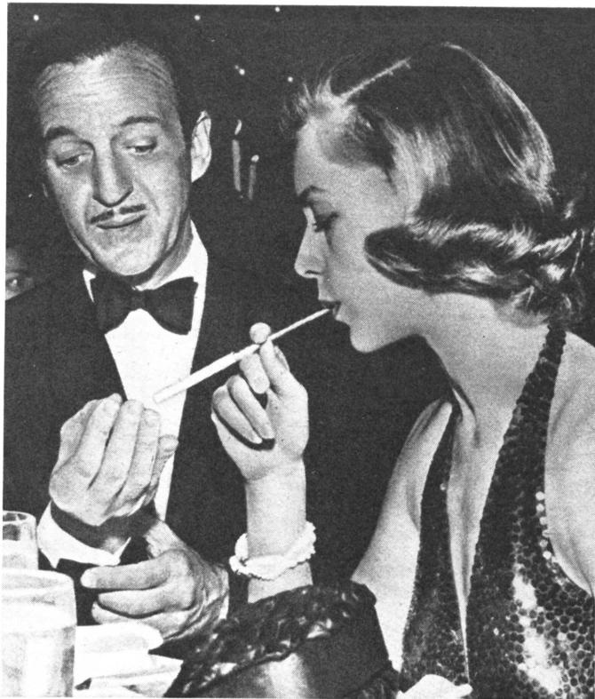
Lauren Bacall, die Witwe Humphrey Bogarts, hat die Filmarbeit wieder aufgenommen.

ZS. Eine Sendung des englischen Rundspruchs über Ostdeutschland begann kürzlich mit einer hübschen Fabel, die eine ostdeutsche Zeitung mutig in den Tagen des ungarischen Aufstandes veröffentlicht hatte: In der Schule von Schilda wurden die Kinder gelehrt, daß 2 + 2 = 9 wäre. Es waren pflichtgetreue Kinder und sie wiederholten es pflichtgetreu. Doch die Schulbehörden wurden unruhig, man könnte anderswo darüber lachen, z. B. im bösen Westen. So wies sie die Leh-