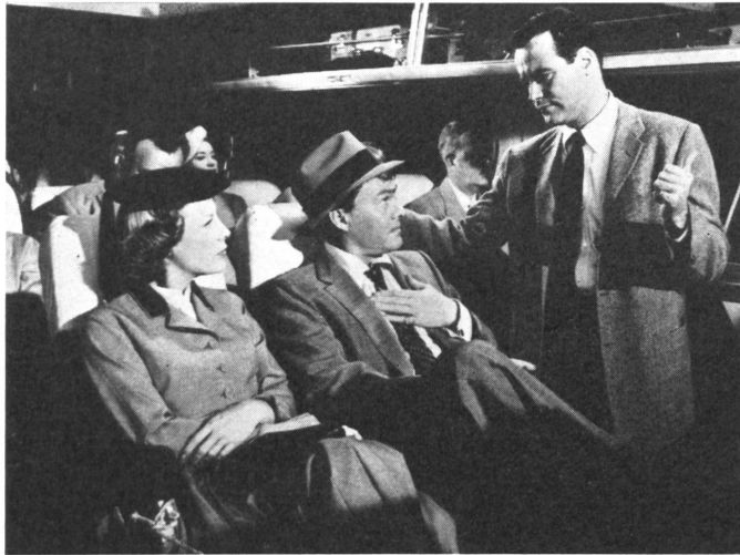
June Allyson in dem heitern Sommer-Unterhaltungsfilm «Mit der Liebe spielt man nicht».

ms. Ein amerikanisches Lustspielchen, bei dem man sich recht wohl unterhält. Das reiche Texastöchterchen hat einen nichtsnutzigen Autorennfahrer geheiratet, Papa ist sehr dagegen und sperrt das dickköpfige Töchterchen ein, das brennt aber durch und reist auf heimlichen Wegen zu ihrem Mann. Unterdessen lernt die Maid einen Journalisten kennen, liebt ihn und heiratet ihn, nachdem der erste Mann