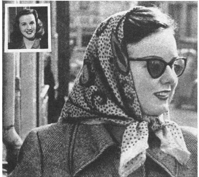
Deanna Durbin heute und wie wir sie vor einem Jahrzehnt in ihren Filmen gekannt haben (oben links).

vorgesprochen, in welchem jede Stunde festgelegt war. Aber ich wollte eine Frau sein wie andere auch.» In Paris hat sie eine Reihe von Filmangeboten abgelehnt, auch solche von französischen Produzenten. «In Hollywood suchte man mich weiterhin in der Rolle des «jungen, unschuldsvollen Mädchens mit der Glockenstimme» zu halten, das Geld einbrachte, als ich schon längst eine erwachsene Frau war. Ich konnte und wollte solche Rollen nicht mehr spielen, aber mein Verlangen nach andern blieb unerfüllt. Es wurden Filme mit mir gedreht, wo ich nur noch mit halbem Herzen mitmachte, und die deshalb keine Erfolge sein konnten. Ich entschloß mich,