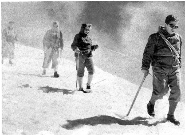
Partie auf dem Grat vor einem Wetterumschwung im Film "SOS-Gletscherpilot"