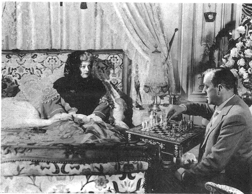
Die grosse Bette Davis in einer kurzen, aber glanzvoll gespielten Rolle im "Sündenbock".

durch die Atmosphäre des Milieus und die hohe Kunst der Schauspieler (unter ihnen in einer kleinen Rolle die grosse Bette Davis) der Film hoch über den langfädigen Roman hinausgehoben.