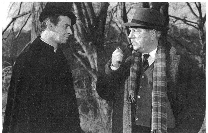
Jean Gabin in einer schon fast klassisch gewordenen Rolle als Kommissär Maigret in dem menschlich vertieften und auch die Frage nach der rechten Seelsorge stellenden Kriminalfilm "Maigret kennt kein Erbarmen".

ms. Nach Georges Simeons Roman "Maigret à Saint-Fiacre" hat Jean Delannoy, der zum eigentlichen Spezialisten für Simeon-Verfilmungen zu werden verspricht, einen Kriminalfilm gedreht, der tief fesselt, nicht so sehr durch seine Spannung, die er selbstverständlich besitzt, als vielmehr durch die Nuancierungen der Menschlichkeit und die Menschlichkeiten. Maigret taucht im Schloss von Saint-Fiacre auf, wo sein Vater einst Verwalter gewesen war und wo er seine Jugend verlebte hatte. Er will den Urheber ausheben von Drohbriefen gegen die