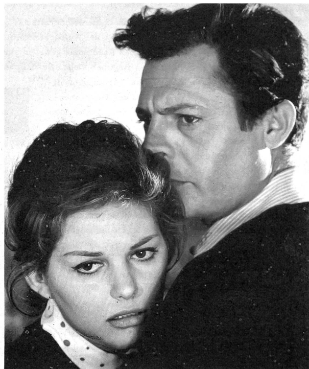
..... im "Bell'Antonio" in einer menschlich vertieften, schwierigen Rolle als gehemmter Mann.

Wer aber nur diese Schicht sieht, erkennt nicht den ganzen Film; erkennt zunächst nicht die authentische Volkshaftigkeit in den Dingen der Liebe selbst und in der Art, wie diese Dinge besprochen werden; erkennt aber auch die Menschlichkeit des tragikomischen Helden nicht, und nicht den sittlichen Rang, der seinem Leiden gegeben ist. Und doch sind diese Bedeutungen greifbar, weil sie künstlerisch erscheinen, Bolognini, dessen formales Talent nicht einmal von jenen abgestritten wird, die ihn nicht mögen, erzählt die Geschichte des schönen Antonio mit einer realistischen atmosphärischen Schilderung, die in guten italienischen Filmen Tradition ist. Er greift indessen über den Realismus hinaus und gelangt zu schönen, poetischen, in der Aussage klaren Symbolformulierungen. Bologninis Schauspielereführung ist brillant; aus mittelmässigen Darstellerinnen wie Claudia Cardinale holt er Bestes heraus, den zur dröhnenden Charge neigenden Pierre Brasseur holt er zurück, und Marcello Mastroianni führt er weiter auf dem von Fellini geebneten Weg zu einem Schauspielertum von reifster seelischer und intellektueller Sensibilität (nicht umsonst ist gesagt worden, Marcello Mastroianni sei für Italien zu dem geworden, was für Frankreich Gérard Philipe gewesen ist). Der Darstellung des schönen Antonio, die Mastroianni gibt, kann sich jedenfalls ein fühlender Mensch nicht verschliessen.