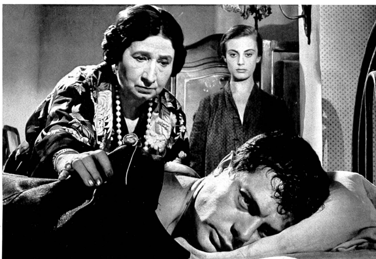
Mastroianni, immer mehr im Vordergrund der italienischen Schauspieler, im formal guten, jedoch politisch tendenziösen Film "Seitengasse", und .....

ms. "Portrait in Black" ist ein amerikanischer Thriller, der es in sich hat. Erzählt wird die Geschichte einer Liebe zwischen der jungen Gattin eines todkranken Mannes und dessen Arzt. Die Liebe zeugt Böses. Die Beiden bringen den Sterbenden um, und das Böse erzeugt wieder Böses, auch ein anderer Mann, ein Widersacher, heimlicher