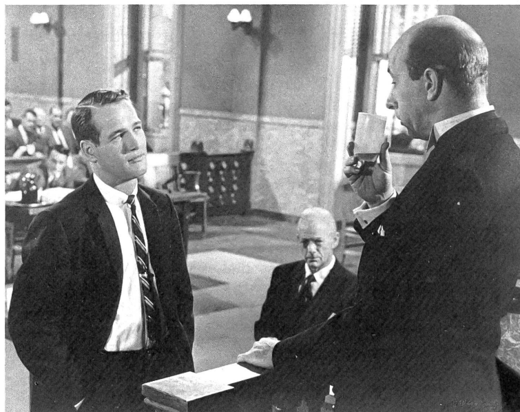
Paul Newman (links) in einer ausgezeichneten Rolle als Anwalt, der sich zu seinem bessern Ich findet, in "Der Emporkömmling".

ge ehrgeizige Mann also, er ist, wie man sogleich erkennt, Rechtsanwalt, verteidigt seinen heruntergekommenen Freund, rettet ihn und er ringt die Achtung vor sich selbst (die er beinahe verloren hatte, weil er einige Male schon zu weich geworden war) und vor seiner Braut. In diese an sich spannende, besonders durch das hervorragende Spiel von Paul Newman anziehende und nüanciert wirkende Geschichte sind nun aber zu viele Motive verwoben, die nur aufgegriffen, nicht ausgeführt werden und die zentrale Geschichte, statt sie zu beleuchten, nur belasten, sie schwer machen, verworren und melodramatisch (wo es mit realistischer Einfachheit auch getan gewesen wäre).