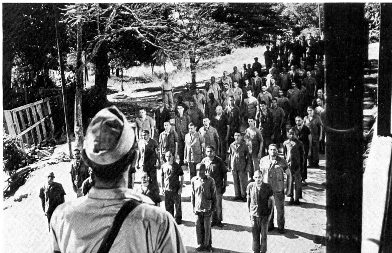
Ausgezeichnet und grosszügig fotografiert ist der sonst äusserst realistische, fast brutale Film "Assassinus", Geschichte eines Massenausbruchs aus einem Gefangenenlager.

ms. Es ist selten, dass brasilianische Filme zu uns kommen. Dieser von Carlos Hugo Christensen geschaffene Film verdient unsere Beachtung, verdient sie vor allem wegen der grossartigen Kameraarbeit und der im expressionistisch-realistischen Stil arbeitenden Regie, die an den grossen Vorbildern des russischen Revolutionsfilms geschult ist. Der Film erzählt von einem (tatsächlich vorgekommenen) Ausbruch von 300 Schwerverbrechern aus dem Gefangenenlager auf der Insel Anchieta und dem Marsch dieser Männer, unheimlicher, böser, ruchloser Gesellen, durch den Dschungel und in den Tod. Die Realistik dieser Erzählung überbietet das meiste, was man in solcher Art bisher gesehen hat, nichts bleibt einem an Härte erspart, und es ist ganz gewiss, dass dieser Härte, diese die Grenzen des Sadismus oft weit überschreitende Brutalität der Darstellung oft zum Selbstzweck wird und darum schockiert, weil ein Gegengewicht der Innerlichkeit kaum vorhanden ist: jedenfalls genügt die Figur des Anführers (den Arturo de Cordoba darstellt), der sich vom hartherzigen, bedenkenlosen Mann zum Wahnsinnigen aus Gewissensnot wandelt, nicht, dieses Gegengewicht zu schaffen. Im übrigen fesselt der Film durch seine Exotik, seine Musik, seine Darsteller, die in den Gesichtern profiliert sichtbar gemacht sind.