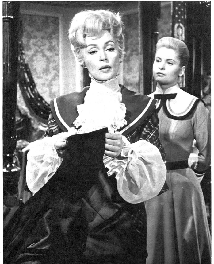
Die Mutter, die ein dubioses Gewerbe betreibt, in der Auseinandersetzung mit ihrer Tochter, die langsam die Wahrheit erfährt, in einer Verfilmung von Shaws "Frau Warrens Gewerbe", die einmal mehr die Kraft und den Scharfsinn von Shaw beweist

ms. Der gute Bernhard Shaw muss wieder einmal daran glauben. Die sozialkritische Komödie um die verschlagene Frau Warren, die in allen Städten der Welt, wo es gut verdienende Herren gibt, öffentliche Häuser unterhält, eine Tochter redlich aufzieht und in schreckliche Nöte gerät, als die Tochter das Gewerbe ihrer Frau Mama erkennt, hat zwar allerlei für sich, doch ist ihre auflüpperische Moral und Tendenz gegen die viktorianische Heuchelei heute längst überholt. Der Film, den die Deutschen gedreht haben, ist aufs Theater zugeschnitten, die Dialoge sind Bühnendialoge, kaum gekürzt, und bereiten den Schauspielern, unter ihnen Lilli Palmer und O. W. Hasse als zynischer Baron, etliche Schwierigkeiten, weil sie mit ihnen kaum fertig werden, bevor sich die Kamera ein nächstes Mal bewegt. Die Änderungen gegenüber der Vorlage sind sonst geschickt vorgenommen worden und betreffen hauptsächlich die Tochter Vivie, die aus einem nüchternen Blaustrumpf hier zu einem sitzenden jungen Mädchen wird, das über die Entdeckungen, die es machen muss, erschauert, womit die ursprüngliche Sozialkritik Shaws stark ins Moralische abgelenkt und vereinfacht wird. Schade, dass der Geistliche im Film noch stärker karikiert wird als bei Shaw, wofür keine zwingenden Motive vorlagen. Man unterhält sich bei den sonst ausgezeichneten schauspielerischen Leistungen gut, ertappt sich aber beim Gedanken, dass es wertvoller wäre, wenn die Filmdeutschen sich zu originalen Filmwerken inspirieren ließen.