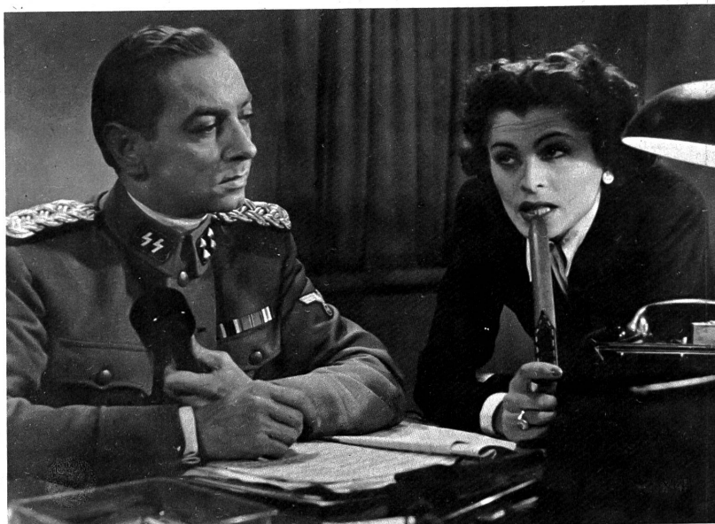
Fruchtbares Wiedersehen mit dem Rossellini-Film "Rom, offene Stadt" und der jungen Anna Magnani.

ms. Auch das ist ein Hollywoodfilm, der eher zum Lachen bringt als uns zu der Erschütterung führt, nach welcher er melodramatisch und buntcoloriert Ausschau hält. Der Film heisst amerikanisch "Two Loves" und wurde am Berliner Festival 1961 gezeigt, was wieder einmal beweist, wie wenig Verständnis die Hollywoodianer für das haben, was einem Festival ansteht. Item, erzählt wird die Geschichte einer Lehrerin, einer Amerikanerin, die in Neuseeland unterrichtet, Maorikinder und weisse Kinder, und die, schon ein wenig dem Altjüngferlichen nahe, unvermutet in die Falle zwischen zwei Lieben gerät: auf der einen Seite ist der präsentable, zuverlässige, ältere Mann, der schon verheiratet ist (Jack Hawkins) und auf der anderen der junge Heissporn, ein am Leben und seinen Gefühlen Verzweiflender, der sich denn auch auf einer rasenden Motorradfahrt das Leben nimmt (Laurence Harvey). Die Frau in der Mitte - Shirley Mac Laine spielt sie gut, doch im Grunde ratlos in der Rolle, die nichts hergibt - weiss lange nicht, wohin sie schwanken soll, flüchtet zuletzt in die starken Arme des Wohlbestallten und Zuverlässigen, der sich von seiner ersten Frau eben hat scheiden lassen. Der Film ist von Charles Walters geschleckt und in buntesten Bildern inszeniert und langweilt von Anfang an zu Tode.