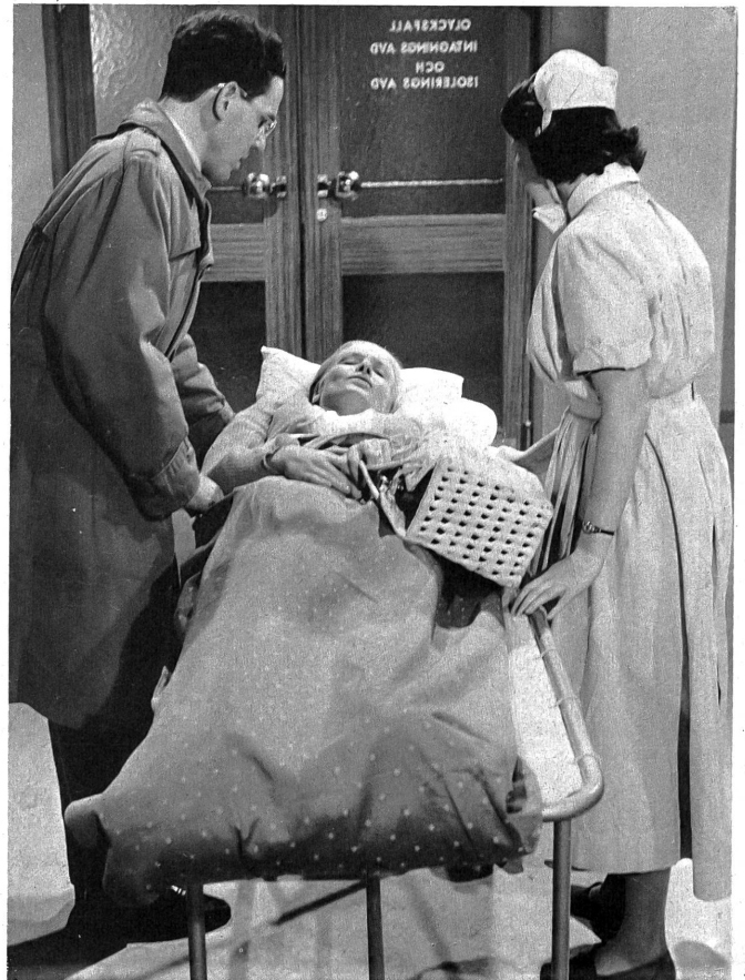
Drei Frauenschicksale verschlingen sich im Film "Dem Leben nahe", in dem auch die Trauer die Menschen reift.

SCHICKSAL EINER UNBERUEHRTEN (The young one)