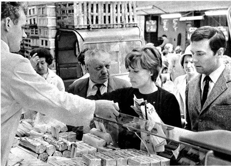
Vergebens sucht im "Irrlicht" der Mann wieder Kontakt mit frühern Freunden. Nichts kann ihn mehr vom Wert des Daseins überzeugen.

Aber schon in der Liebe tritt ihm das Vergängliche entgegen. Und überall, wo er mit den alten Freunden von einst zusammentrifft, erkennt er Veränderungen, die ihm als Verfallserscheinungen vorkommen, muss er sogar Demütigungen ernten, kann er bei dieser im ganzen im Sinken begriffenen zeitgenössischen Gesellschaft keinen Kontakt mehr finden, wird er in seinem Entschluss bis zur Endgültigkeit bestärkt. Nirgends die Zeichen einer innern Erneuerung. Spiessbürgertum, Rückkehr zum frühern Lasterleben, gute Worte ohne Substanz bekommt er zu hören oder werden ihm vorgeschlagen. Niemand kennt den Abgrund seiner Einsamkeit. Er kehrt zurück und stirbt mit einem Protest gegen alle: "Ich lösche mich aus, weil Ihr mich nicht geliebt habt, weil ich Euch nicht zu lieben vermochte".