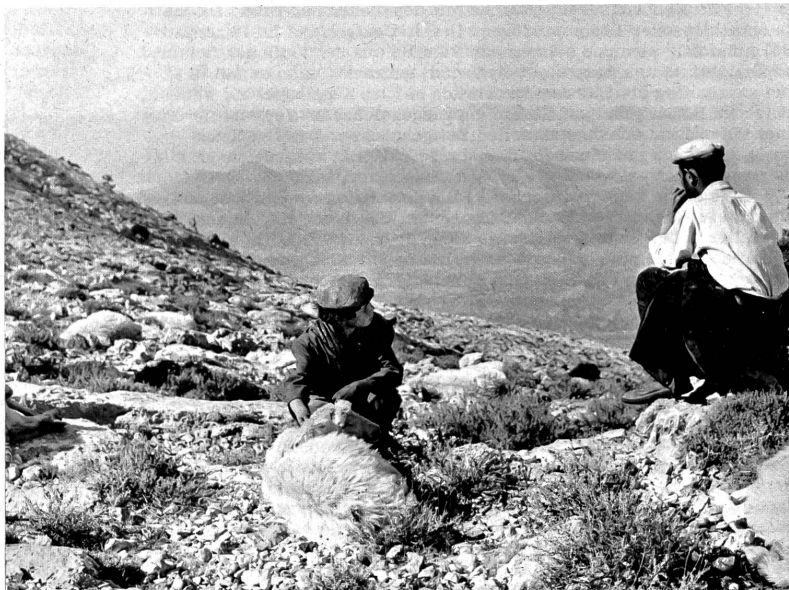
Von einem harten Leben in harter Landschaft (Sardinien) und ihrer kargen Schönheit erzählt der Film "Banditen in Orgosolo"

Und dieses Vollenden des Schicksals macht klar, dass Vittorio de Seta, mag er formal auch Flaherty nahe stehen, ganz andern Geistes als dieser ist. Für Flaherty bedeutete es den Sinn des Daseins erfüllen, wenn der Mensch sich im Triumph über die Natur erhob, im Widerstand gegen die Elemente sich behauptete. Nichts von dem ist da bei Vittorio de Seta, der, indem er den Vollzug des Schicksals an seinem bescheidenen Helden aufzeigt, sich zum getreuen Deuter der Lebenswirklichkeit, des Lebensbewusstseins dieser Hirten und Bauern auf Sardinien, in Sardinien innerstem Land macht. Eine alte, verloren geglaubte Welt dringt herauf, die Welt von Menschen, die Ehre haben und aus verlorenen Ehre handeln, auch wenn dieses Handeln zum Tode führt; Menschen, die sich ihrer Natur nicht widersetzen, die nicht reden, wo das