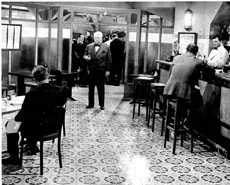
Jean Gabin als abgebrannter Pseudo-Gentleman, etwas müde geworden, im Film "The Gentleman d'Epsom"