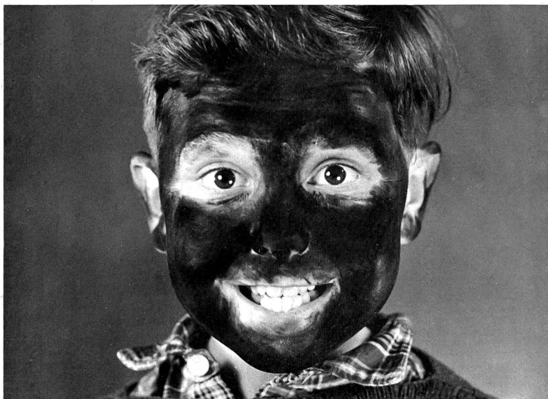
Der kleine Neger ist bereit, die Theatervorstellung kann beginnen im Film "Schön war die Jugendzeit"