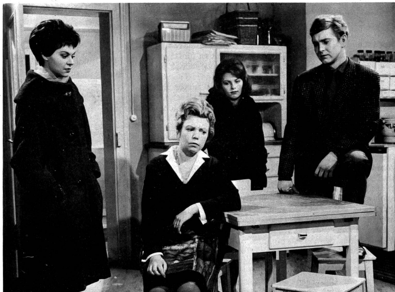
Unterhaltende Ausschnitte aus dem kleinbürgerlichen Familienleben bringt der neue, volkstümliche Schweizer Film "Im Parterre links".