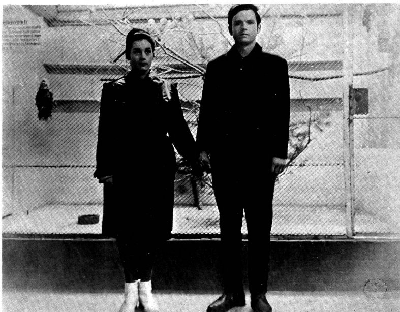
Im "Brot der frühen Jahre", einer deutschen Film-Etüde, wird der Ausbruch eines jungen Mannes aus der Konvention zu zeigen versucht.