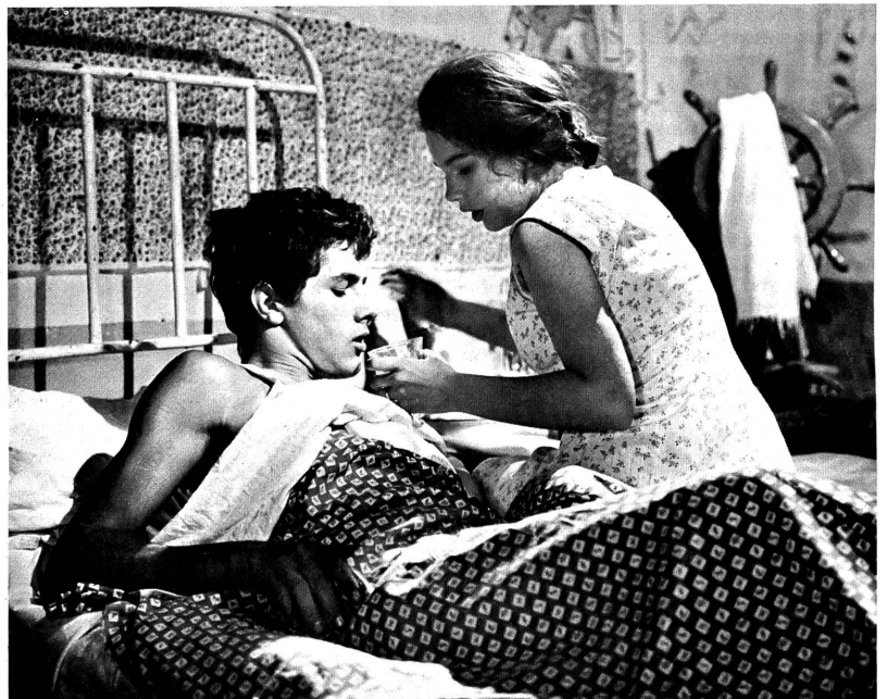
"Die Insel der verbotenen Liebe" zeigt in feinsinniger Weise die Entwicklung eines Knaben zum Mann.

No. 1072: 50 Jahre Lötschbergbahn - Physik im Dienst der Heilkunde - Die Hand des Menschen - Tour de Suisse.