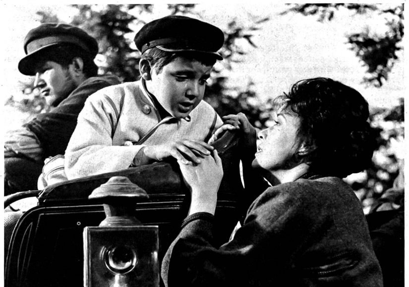
Der Abschied des Knaben von seiner Mutter vor der abenteuerlichen Reise im Film "Die Steppe", der ein italienisch gesehenes Russland zeigt, das aber doch eine Ahnung vom Charakter des Landes und seiner Bewohner vermittelt.

Tschechow erzählt uns diese Geschichte gleichsam als einen Traum, durchsichtig auf Natur und Mensch, als frühes Leid und reifendes Begreifen eines Kindes, behutsam, leise. Lattuada, der immerhin einmal Schöpferisches im Film geschaffen hat ("Il capotto"), seinerseits erscheint hier als einer, der alles Fingerspitzengefühl verloren hat. Breit, massig kommt die Erzählung daher, aber ohne Feinstreife ist sie ins Bild übertragen. Die italienischen, die französischen und die jugoslawischen Darsteller, die er als Russen bemüht, tragen alle dick auf, das Russentum wirkt mastig, kaum ein Körnchen Echtheit strahlt von diesen Menschen aus. Russen allein sind imstande, diese zarte Novelle in den Film umzusetzen; geschieht es im europäischen Westen, so bleibt kein anderes Vorgehen offen als das der örtlichen und figürlichen Transposition. Wer sollte das besser wissen als Lattuada, der solches schon mit Erfolg und künstlerischem Feingefühl getan hat. Was er uns jetzt zeigt, ist ein bunter Bilderbogen mit bärbissig schauenden und breitbeinig schreitenden Kerlen darin. Wer allerdings Tschechow nicht kennt, für den gibt der Film immerhin eine Ahnung von der Weite des russischen Landes und der grenzenlosen Vitalität seines Volkes.