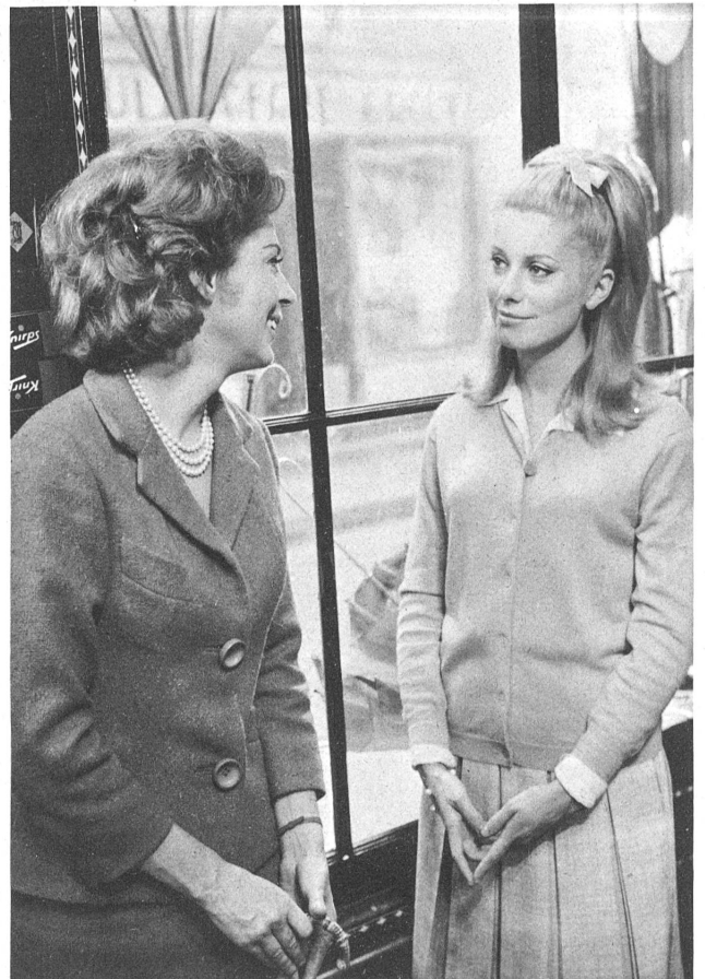
Catherine Deneuve (rechts) mit Anne Vernon, die Hauptrollen in dem musikalischen Experiment "Die Regenschirme von Cherbourg" spielen.

Der Film ist ein ziemlich gewagtes Experiment: er wird vom Anfang bis ans Ende gesungen. Er ist aber nicht einfach ein verfilmtes Bühnen-Musical, sondern eine Original-Schöpfung; der von Regisseur Demy verfasste Text wurde von Legrand besonders komponiert. Es han-