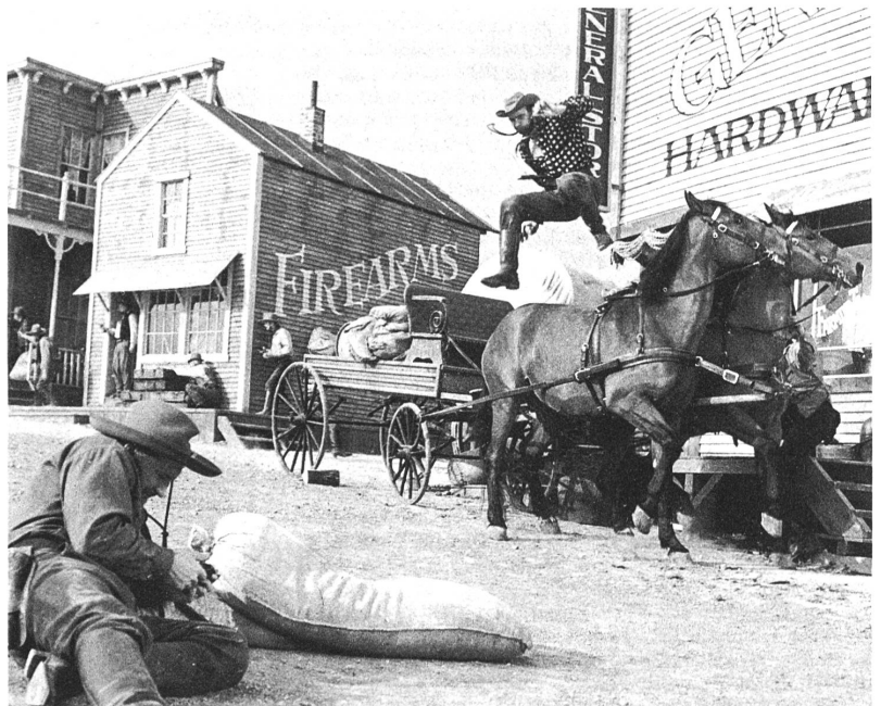
"Limonaden - Joe" ist eine gelungene, tschechische Parodie auf den amerikanischen Wild-Westfilm

- Bereits zum zwölften Mal hat das "Studio Hamburg" Praktikanten künstlerisch-technischer Berufe für Film und Fernsehen nach 18 monatiger Ausbildungszeit mit Diplomen entlassen. Veranstaltet werden diese Kurse durch die "Arbeitsgemeinschaft zur Nachwuchsförderung für Film und Fernsehen" in Hamburg. Bisher konnten schon 140 junge Leute als Kameraleute, Aufnahmeleiter, Bühnenbildner und Cutter auf diese Weise eine Basis - Ausbildung erhalten. Besonders gefragt sind Aufnahmeleiter. (KiFe).