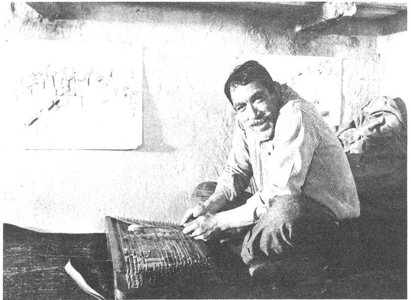
Ewig jung, immer optimistisch, schwankt Sorbas (A. Quinn) animalisch zwischen Zärtlichkeit und Grausamkeit, Liebe und Tod.

Dabei bleibt Cacoyannis bei aller stilistischen Prägung, die aus der Spannung und dem Gegensatz von klassischer Bildkomposition und dionysisch-leidenschaftlicher Bewegtheit der Bildvorgänge lebt, ein