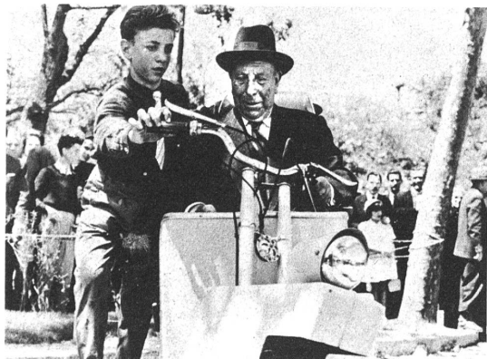
Eine gute Reprise ist der spanische Film "Der Rollstuhl", einer tragischen Satire von grimmigem Humor von einem einsamen Alten

Alexander Mackendrick ist ein sensibler Künstler: mit kleinsten Veränderungen, aber intensiv macht er das Umschlagen von Schuld in Unschuld ( bei den Kindern ), von Schuldigkeit in Unschuld und Harm-