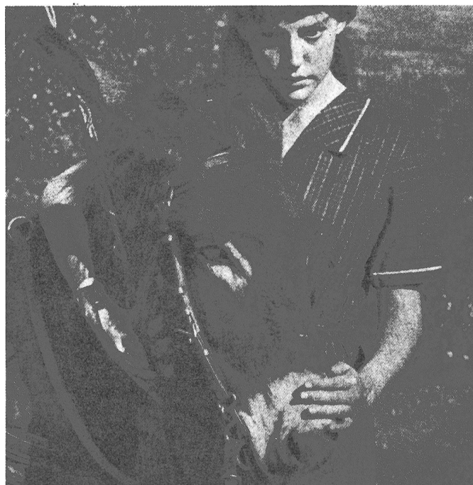
Ein Eselchen spielt in dem poetisch-dichten Film von Bresson die Hauptrolle und errang wie in Cannes so auch in Venedig grossen Erfolg.

Leider kann er seine Tätigkeit erst im Lauf des nächsten Jahres aufnehmen, wo ein grosses Arbeitsfeld seiner harrt, besonders auf dem Gebiet der Filmerziehung von der Volksschule bis zur Universität, das bisher praktisch brach lag.