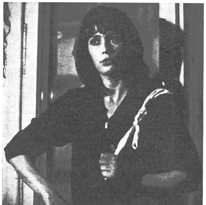
Alexandra Kluge, die sich als hervorragende Schauspielerin im Film «Abschied von Gestern» erwiesen hat, der an der Tagung der Interfilm in Arnoldshain gezeigt wurde

Denn McQueen, der immer farbloser wird, je länger er den reinen Toren zu mimen hat, muss erst das «Waffenhandwerk» erlernen, er muss uns erst begreiflich machen, dass «er nach Frauengunst nicht giert», so lange «der Gerechtigkeit nicht Nachachtung geschaffen worden ist», kurz, es geht altväterisch und langatmig zu. Den ersten Schuft trifft er dann in einem Saloon und . . . kchkchkch! Um den zweiten zu kriegen, muss er sich im Süden und inmitten von «swampwaters» in eine Strafkolonie begeben, wo Suzanne Pleshette «ihn in den Bannkreis der Liebe zieht». Doch der reine Tor steigt auch über dieses hinweg, und dann rettet ihn Raf Vallone mit der Bibel in der Hand, denn Vallone ist diesmal Mönch. Doch die Rache ist stärker denn die Klosterklausur, und endlich und mitten durch einen Goldtransport hindurch trifft der reine Tor auf den dritten Mörder am Bach unten, und der Schluss ist dann Verlegenheit. Einer jener modernen Western, die nicht mehr den Mut zur eigenen Schablone aufbringen, sondern sich in fader Selbstinterpretation zerfasern.