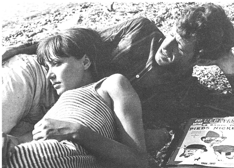
Der Mann, der sein Freiheitsstreben als Illusion erkennen muss, in "11 Uhr nachts"

So ist der Film ein Sinnbild manches heutigen, teils in intellektuelle Spintisiererei, teils in ästhetisches Gezauber verstrickten Kul-