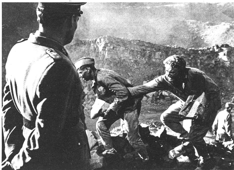
Die Leiden der russischen Kriegsgefangenen in Deutschland zeigt der russische Film "Ein Menschenschicksal" in fast lyrischer Aufrichtigkeit

Das alles war und ist, sieht man genau hin, so neu natürlich nicht: aber es wurde, wie bei dem viel romantischer gestimmten und