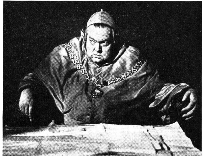
Orson Welles als Kardinal Wolsey im Film «Ein Mann zu jeder Jahreszeit»

Ein Mann kann staatliche Forderungen mit seinem Gewissen nicht vereinbaren und nimmt alle Folgen bis zum Tode auf sich, das ist das Thema des Films. Aber es ist für den Film immer schwierig gewesen, in ein Gewissen hinein zu leuchten. Das Nein zum staatlichen Anspruch kann das Nein eines Fanatikers sein, kann aus verletztem Selbstgefühl, aus Ressentiment bis zum tödlichen Hass, oder auch in Selbstmordabsicht erfolgen. All das wurde Morus auch von seinen Gegnern vorgeworfen. Es kann aber auch aus vornehmster Gesinnung ausgesprochen werden, aus einer auf tieferschürfender Einsicht gegründeten Ueberzeugung, oder aus einem felsenfesten Glauben, der dem Staat nur