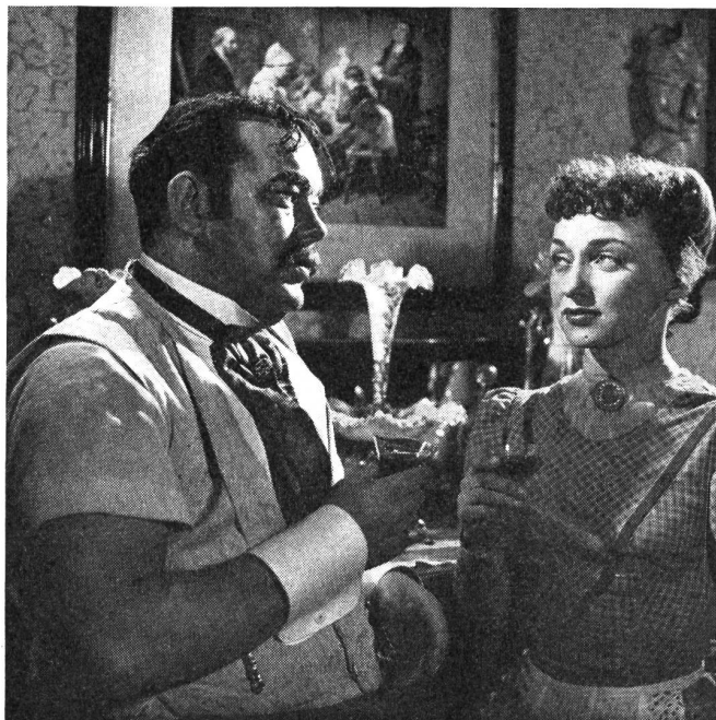
Nichts als Demütigungen ernten die Menschen des Wanderzirkus in Bergmans «Abend der Gaukler», hier der Direktor, der wieder zu seiner Frau zurückkehren möchte.

Doch hier wühlt Bergman vergebens nach dem Sinn des Leidens. Er bewältigt es nicht, bleibt in einem leeren Pessimismus stecken. Und nach jenem, der uns das Leiden schickt, Gott oder der Zufall oder der Teufel, sucht er überhaupt nicht. Diese doppelte Blindheit könnte einem den Film verleiden, wenn er nicht so bildkräftig gestaltet wäre. Auch hier zeigt sich wieder Bergmans Gestaltungsvermögen, seine von der Theaterarbeit stammende Sicherheit, sein filmisch begabtes Auge, der Sinn für Traumhaftes, aber auch die Symbolkraft des Ausdrucks. In gewissen Augenblicken scheinen Bilder von Munch vor uns lebendig zu werden, aber auch Strindbergs Geist weht durch manche Szene. Auch wenn Bergman selbst den Film als abgelegte Eierschale betrachtet, wird dieser doch seinen bestimmten Platz in der Filmgeschichte behalten und immer eine Diskussion, allerdings in Moll, wert sein.