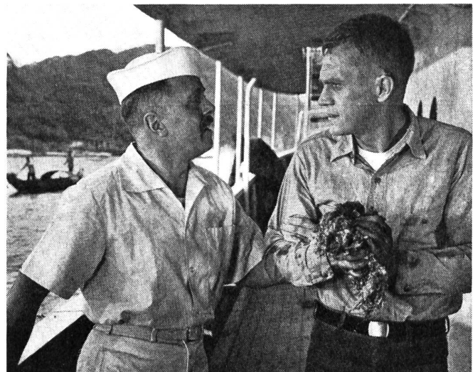
Im «Kanonboot auf dem Yangtse-Kiang» sind interessante Ansätze zu einer Auseinandersetzung über die Frage des Verhältnisses von Weiss und Gelb zu erkennen.

Nun ist für die richtige Beurteilung des Films nicht so sehr die — stets unterschwellig gehaltene — Auseinandersetzung zwischen Kommandant und Unteroffizier entscheidend. Ausschlaggebend ist die Tatsache, dass Holman als Soldat kämpft und fällt, obwohl er innerlich dem Mitunwiderstrebt, obwohl er vom Töten entsetzt ist, obwohl er persönlich der grossen Politik und ihren tieferen An-