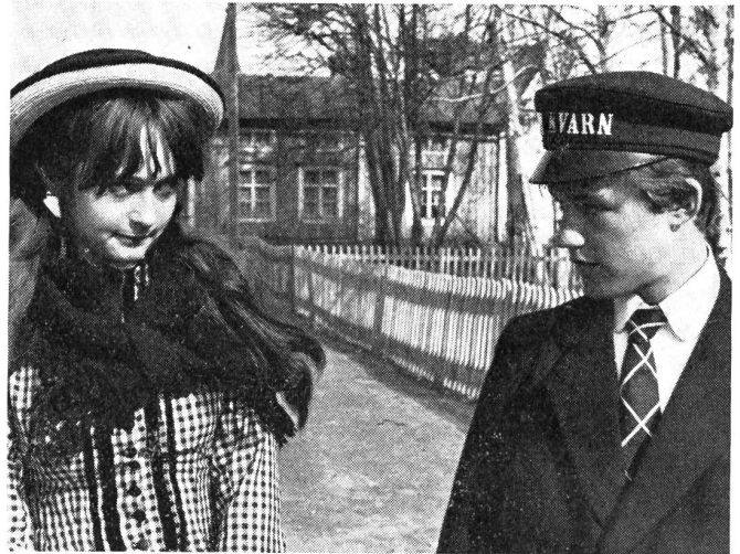
Erste Begegnung des jungen, armen Nord-Schweden mit dem andern Geschlecht in dem von der Interfilm in Berlin ex aequo ausgezeichneten, schwedischen Film «Hier hast Du Dein Leben»

Das alles könnte eine witzige Satire auf verschiedene Auswüchse werden, besonders, weil ein Mann von unbestreitbarem filmischen Können sich der Sache annimmt. Manches auf diesem Gebiet bietet Angriffsflächen genug. Auch die Kirche — wir haben noch nie so skrupellos berechnende Geistliche auf der Leinwand gesehen — wäre