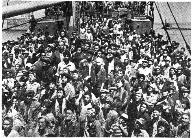
Die Juden auf dem blockierten Schiff «Exodus» im gleichnamigen, problematischen Film kämpfen für die Ausfahrt nach Palästina.

Leider hat der Film keinen Dokumentarcharakter, seine Darstellungen sind mit Vorsicht zu geniessen. Mit fast wild-westhafter Härte und Verschlagenheit lässt Preminger seine Landsleute gegen die Engländer, die gegenüber den