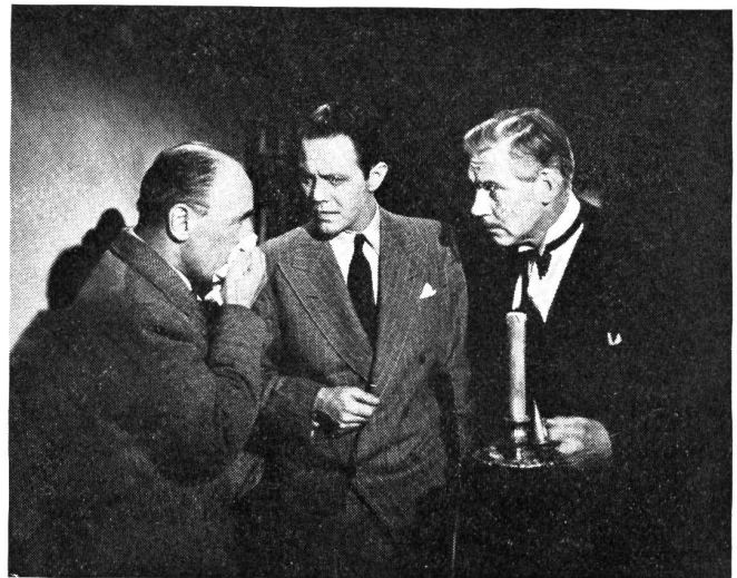
Nächtliche Lagebesprechung von dreien der Opfer, die wegen früherer Untaten gerichtet werden sollen, im Film «10 kleine Negerlein».

Es ist gewiss nur die Verfilmung eines Krimis der scharfsinnigen Agatha Christie, deren Unterhaltungsromane dieses Schicksal oft erlitten. Doch hier geriet das Buch in die Hände eines Meisters. Zwar konnte es sich der damals in Hollywood lebende, aus Frankreich geflüchtete Emigrant René Clair nicht leisten, einen Film zu drehen, der kassenmässig ein Misserfolg hätte werden können. Er musste auf Sicher gehen, was ausser in der Stoffwahl auch in manchen routinehaften Konzessionen an einen