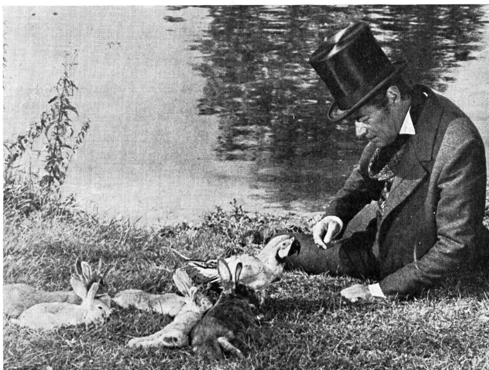
Die Tiere erweisen sich in dem Film «Dr. Dolittle» als ausgezeichnete Schauspieler.

Da die Märchenatmosphäre nicht durchgehalten werden konnte, ist eine Diskrepanz zwischen Tatsachen und Erdichtungen entstanden. Das drückt auf die innere Glaubwürdigkeit, es scheint vieles trotz des grossen Aufwandes als zu nüchtern, zu direkt. Leider ist die Musik dürftig und ohne Einfälle. Nur einzelne Texte der Songs sind gut, darunter einer, der einen Protest gegen die Art darstellt, wie wir Menschen mit den Tieren umgehen. Die Gestaltung ist konventionell, man hatte es trotz des grossen Aufwandes, der Zeit erfordert hätte, offenbar eilig, rasch die gute Stimmung, welche das vorangegangene Musical «My fair Lady» im Publikum hinterlassen hatte, auszunützen. Doch ist im ganzen immer noch ein sympathischer Familienfilm mit manchen heiteren Momenten daraus geworden.