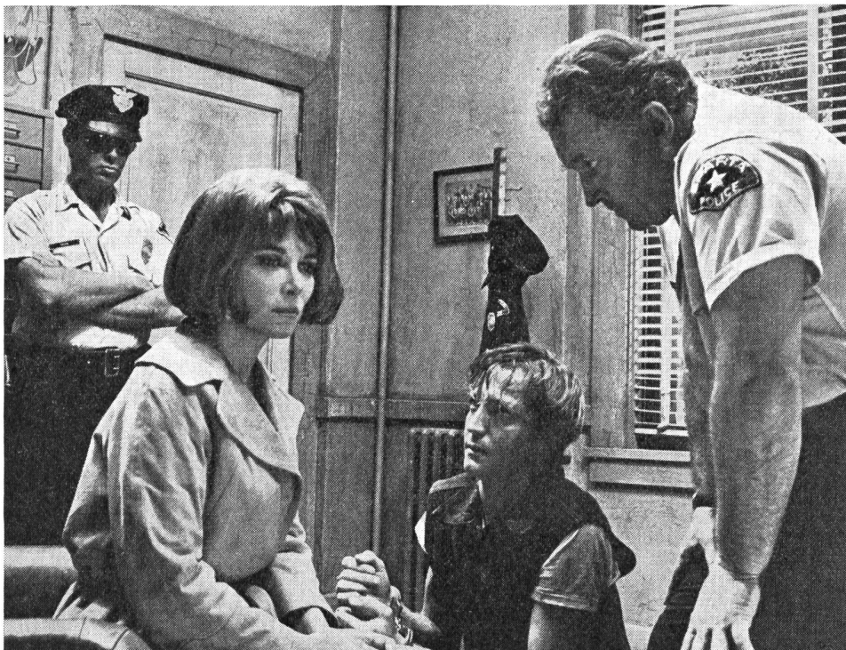
Rod Steiger (rechts) lässt einen Unschuldigen verhaften (links von ihm), der dann von dem gehassten schwarzen Kollegen als solcher festgestellt wird.

tz. «Ximeroni» ist das griechische Wort für Morgendämmerung. Von einer Morgendämmerung in übertragendem Sinn berichtet der vorliegende Dokumentarfilm von