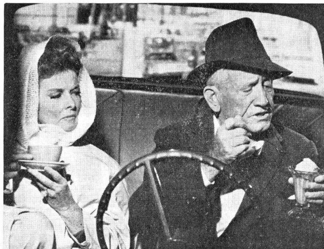
Spencer Tracy und Katherine Hepburn, die aus der Filmgeschichte nicht wegzudenken sind, in ihrem letzten Film «Rate mal, wer zum Essen kommt», wenige Wochen vor dem Tode Tracys. Katherine Hepburn hat soeben den «Oscar» erhalten.

der Kamera steht; kurz darauf ist er gestorben. Auch Katherine Hepburn, mit der zusammen er insgesamt neun Filme gedreht hat, steht nochmals an seiner Seite. Man hätte dem Paar, das einzeln und zusammen Filmgeschichte gemacht hat, einen packenderen Abgang gewünscht.