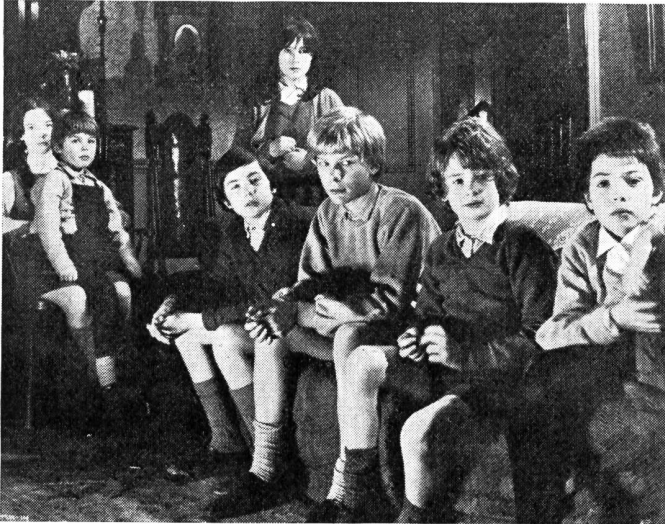
Eine Kindergemeinschaft um eine tote Mutter, hervorragend gespielt, aufgespalten und bedroht durch die Welt der Erwachsenen in «Jede Nacht um 9».

sofort als Vater an, die andern misstrauen ihm. Langsam reift eine Katastrophe heran, die einzige Schwäche des Films liegt in der Tatsache, dass Bogarde zu nahe an seine Rolle in Joseph Loseys Film «The Servant» heranrückt. Doch Clayton versteht es, ganz ohne aufgesetzte Psychologie auszukommen. Schritt für Schritt zeigte er den wachsenden Konflikt der Kinder mit einem Mann auf, der von Tricks, raschem Genuss und schneller Befriedigung lebt. Sinnbild des miefigen kleinen Mannes. Dem schliesslich nur eine Chance bleibt: die Entlarvung der Mutter aller sieben Kinder. Eine Tat, die er sogleich mit dem Leben bezahlt. Hier die leidgeprüfte, gläubige und sehnsuchtsvolle Welt der Kinder, dort die seelisch kahlgefressene Welt unerwachsener Erwachsener und im Brennpunkt des Konflikts die unverhüllte Katastrophe. Clayton dreht hier souverän einen Film minuziöser Feststellung seelischer Regungen in den verschiedenen Bereichen von sieben Kindern und einem Mann. Ein überaus sehenswerter Film.