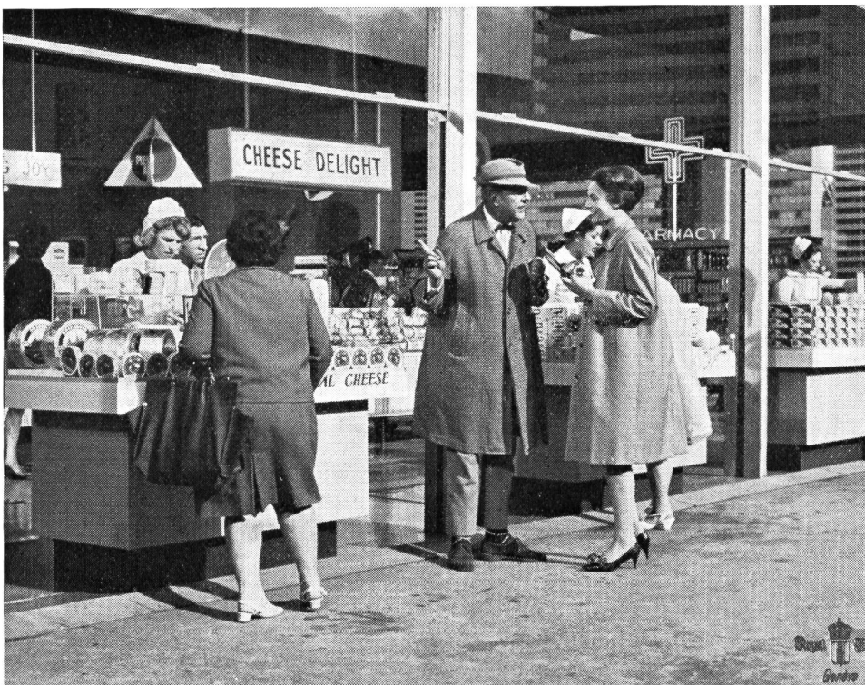
Tatis einmalige, kritisch-lustige Schilderung von Zeitgenossen, demontiert einige exklusive Einrichtungen und Gewohnheiten unserer Zeit.

Dann und wann brennt ein bisschen Elektronik durch, und einige Lampen zerpaffen. Alle nackten Rückenpartien der Damen zeigen das Muster der royalistischen Stühle. Die Kellner zerfetzen ihre Kleidung, und in der Bar fällt regelmässig jemand vom hohen Stuhl. Dann bricht ein Stück Dekoration zusammen. Der Geschäftsführer bricht auch leicht zusammen. Das Essen wird kalt, dafür steigt die Temperatur im Saal ständig an. Ununterbrochen läuft der Innenarchitekt herum, bosselt hier, haut dort auf zwei drei Köpfe, hält falschen Marmor fest oder knistert mit den Plänen. Dann zerspringt eine der teuren Glastüren. Doch um den Abend zu retten, hält der Portier den Türknauf fest und mimt Glastüre. Tati ist nie verlegen. Ganz