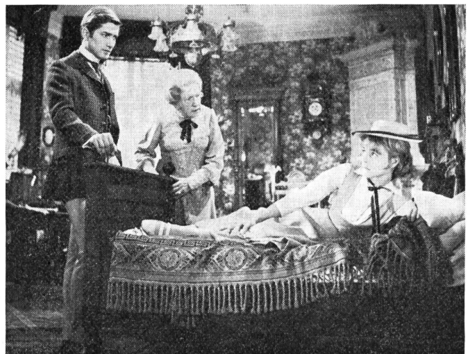
Die beiden Liebenden, die sich endgültig finden, im Unterhaltungsfilm «Schloss Rheinsberg»

FH. Rheinsberg war einst das Lieblingsschloss Friedrichs des Grossen, und dorthin hat Kurt Tucholsky eine Berliner Liebesgeschichte verlegt, «Bilderbuch für Verliebte», die zum Reizendsten gehört, was er geschrieben hat. Zwei junge Menschen haben sich in einem unglaublich schönen Berlin von einst kennen gelernt, und begeben