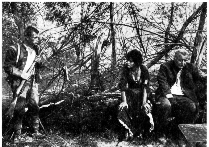
Eine Idylle aus dem 1. Weltkrieg schildert der Film «Das Mädchen und der General», die jedoch durch die brutale Kriegswirklichkeit zerstört wird.

Es ist jedoch nicht die Aufgabe einer Wochenschau, Rätsel zu lösen. Und als solche, die durchaus ihre Berechtigung hat, kann der Film als empfehlenswert bezeichnet werden. Vielleicht findet Israel Zeit, einen durchgearbeiteten Dokumentarfilm über das ganze Geschehen zu drehen, er könnte des weitesten Interesses gewiss sein.