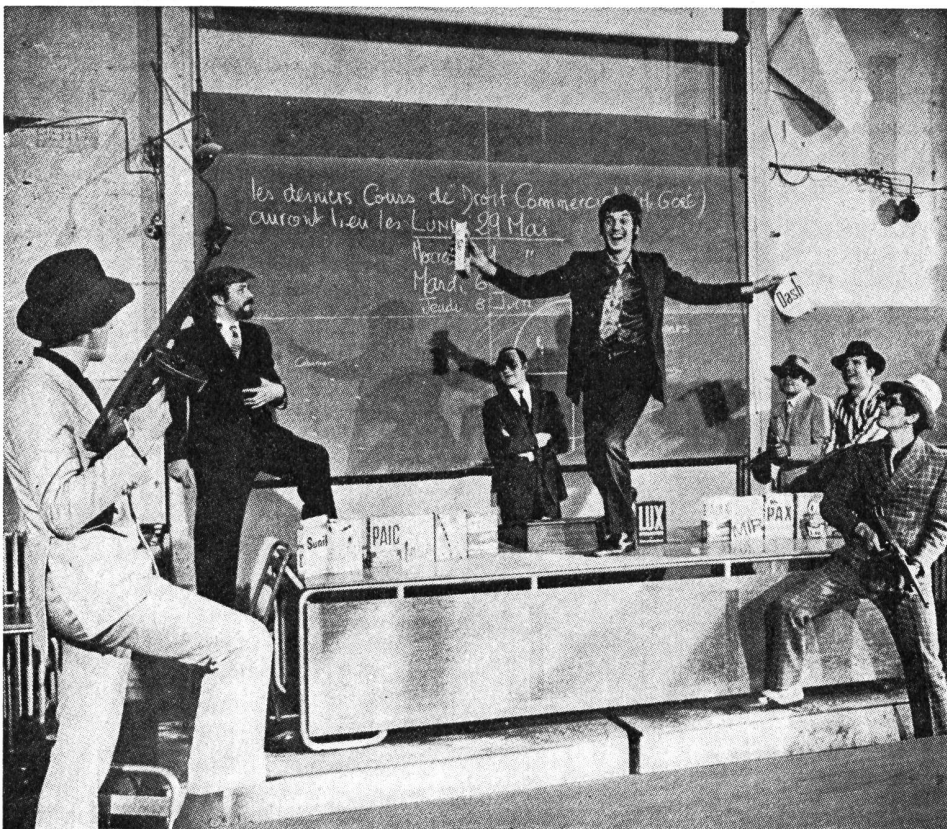
In Locarno waren auch, zum Teil von Godard zu Propagandazwecken mitgebracht, Filme über die studentische Revolution zu sehen, hier ein sehenswerter objektiver, «Les enserclés».