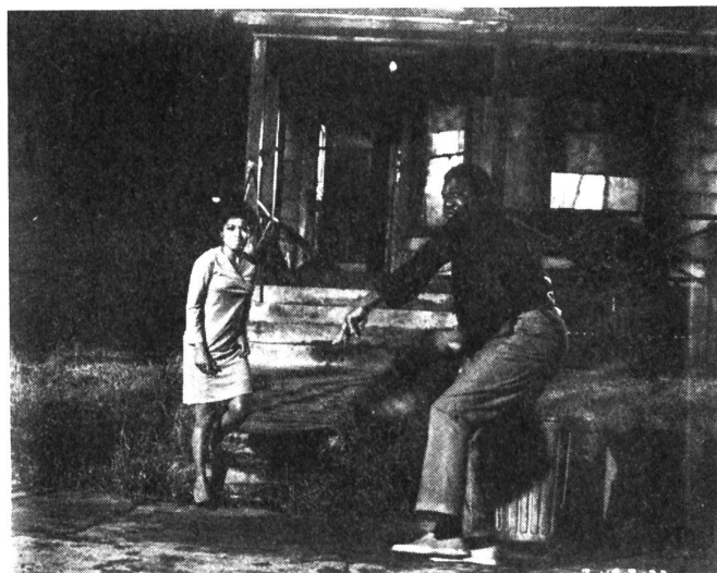
Im Film «Black Power» («Der Verräter») hat Jules Dassin seine Auffassung von der Ausweglosigkeit der Negerrevolution erneut unterstrichen.

«Black Power» exponiert die Situation der Neger in den amerikanischen Grosstädten. Als Vorlage diente Dassin