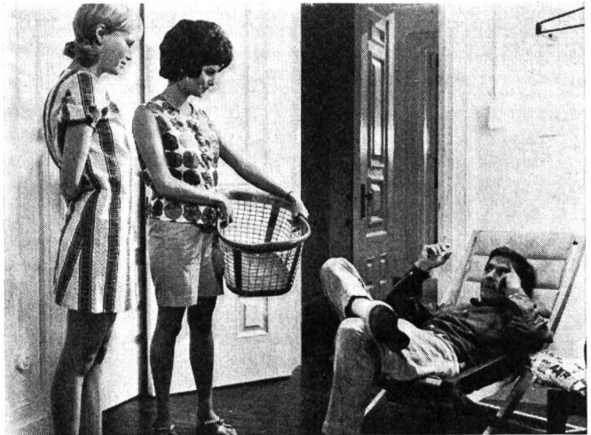
In «Rosemarys Baby» ahnt die Ehefrau (links) noch nicht dass ihr Mann der schwarzen Magie verfallen ist.

form, wie sie der Filmfreund aus den Werken von Alfred Hitchcock kennt? Wohl deshalb, könnte man spekulieren, weil diese Form wie keine andere sich eignet, eine Story gradlinig zu erzählen und gleichzeitig die Spannung — hervorgerufen durch einen unbestimmten Faktor — auf den Höhepunkt zu treiben. Doch gerade hierin unterscheiden sich Hitchcock und Polanski. Während beim Altmeister des Kriminalthrillers die Spannung auf ihrem Höhepunkt aufgelöst wird und für den Zuschauer das grosse «Aha-Erlebnis» stattfindet, setzt Polanski dort ein grosses Fragezeichen. Am Ende des Films beginnt bei ihm die Auseinandersetzung. Nichts wäre verheerender, als wollte man den Film auf den einfachen Nenner der Romanvorlage zurückführen, der einzig um einer spannenden Handlung willen, die Menschwerdung des Teufels schildert. Polanskis Werk lebt von der Reflexion, die darüber angestellt wird. Wer bloss hingehht, um einen Gruselfilm zu sehen, wird deshalb nicht auf die Rechnung kommen.