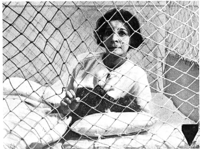
Menschen, die unter Druck durch politische Gewalttätigkeit stehen und ihre Atmosphäre sind Gegenstand des tschechischen Films «... und der 5. Reiter ist die Angst»