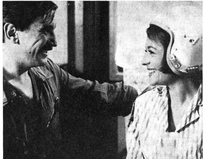
Die wankelmütige Lehrerin (Annie Girardot), die im Film «Es regnet in meinem Dorfe» viel Unheil anrichtet.

Petrovics Blick auf die Menschen ist unverstellt: seine Menschen begegnen sich gleichsam nackt, ihre Empfindungen, ihre Leidenschaften sind ungebrochen, kein Bewusstsein filtrierte sie, keine Moral verfeinert oder spaltet sie. Diese Elementarität der Gefühlswelt ist die Basis seines Realismus. In Spannung zu diesem Realismus befin-