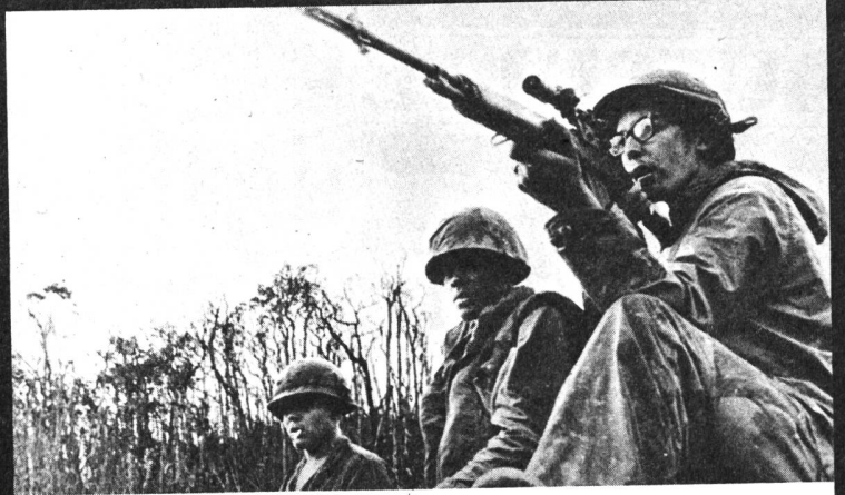
«The Quiet Mutiny» (Grossbritannien)