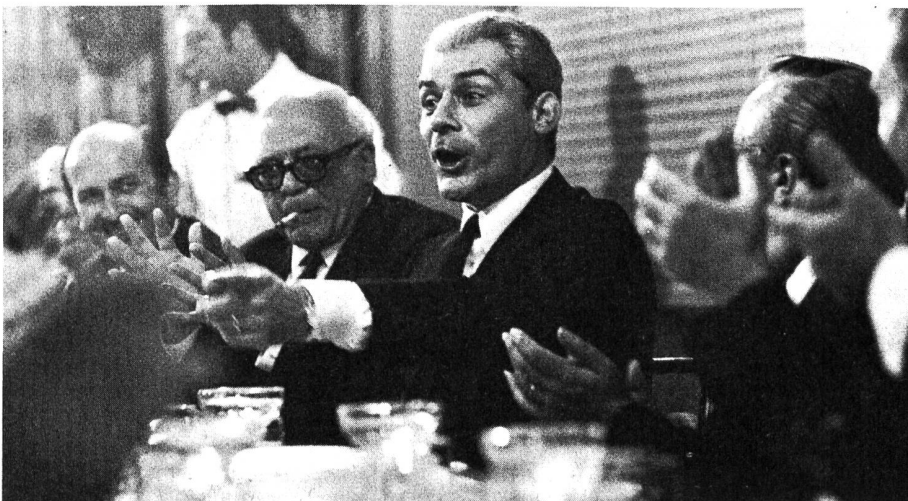
Gian-Maria Volontè in Francesco Rosis «Il caso Mattei»

rische Fetzen und taucht schliesslich ins volle Leben der Stadt mit ihren Familien und heissgeliebten Ungeheuern, die zärtlich Bambini genannt werden, zeigt die Restaurants als Horte der Lebensfülle, kriegt Papagalli, Hippies und amerikanische Touristen vor die Linse und führt dann seine Zuschauer auf einer irren Fahrt über den nicht minder irren Autobahnring um die Stadt: eine Sequenz, die sich ausnimmt wie eine Episode aus Dantes Hölle und die es tatsächlich auch ist. Doch Rom besteht nicht nur aus einigen überbauten Hügeln, sondern auch aus einem Untergrund, aus Katakomben, in denen wertvolle Fresken in Sekunden schnelle verfallen, wenn sie mit Sauerstoff in Berührung kommen, aus U-Bahnschächten, durch die noch eine Ewigkeit lang keine Züge donnern werden, und aus Bordellen, die so alt und traditionell sind wie die Stadt selber. Rom aber ist auch der Sitz des Vatikans, dessen äusserliche Pracht Fellini mit einer Modeschau für klerikale Gewänder geradezu schon unverföhren persifliert. «Federico, geh schlafen!» ruft Anna Magnani dem Regisseur gegen Ende des Filmes zu; doch schlafen wird Fellini nicht können: Mit infernalischem Getöse nehmen Roker nächtlicherweise von der Stadt Beschlag und ersticken sie in einer Lärmflut