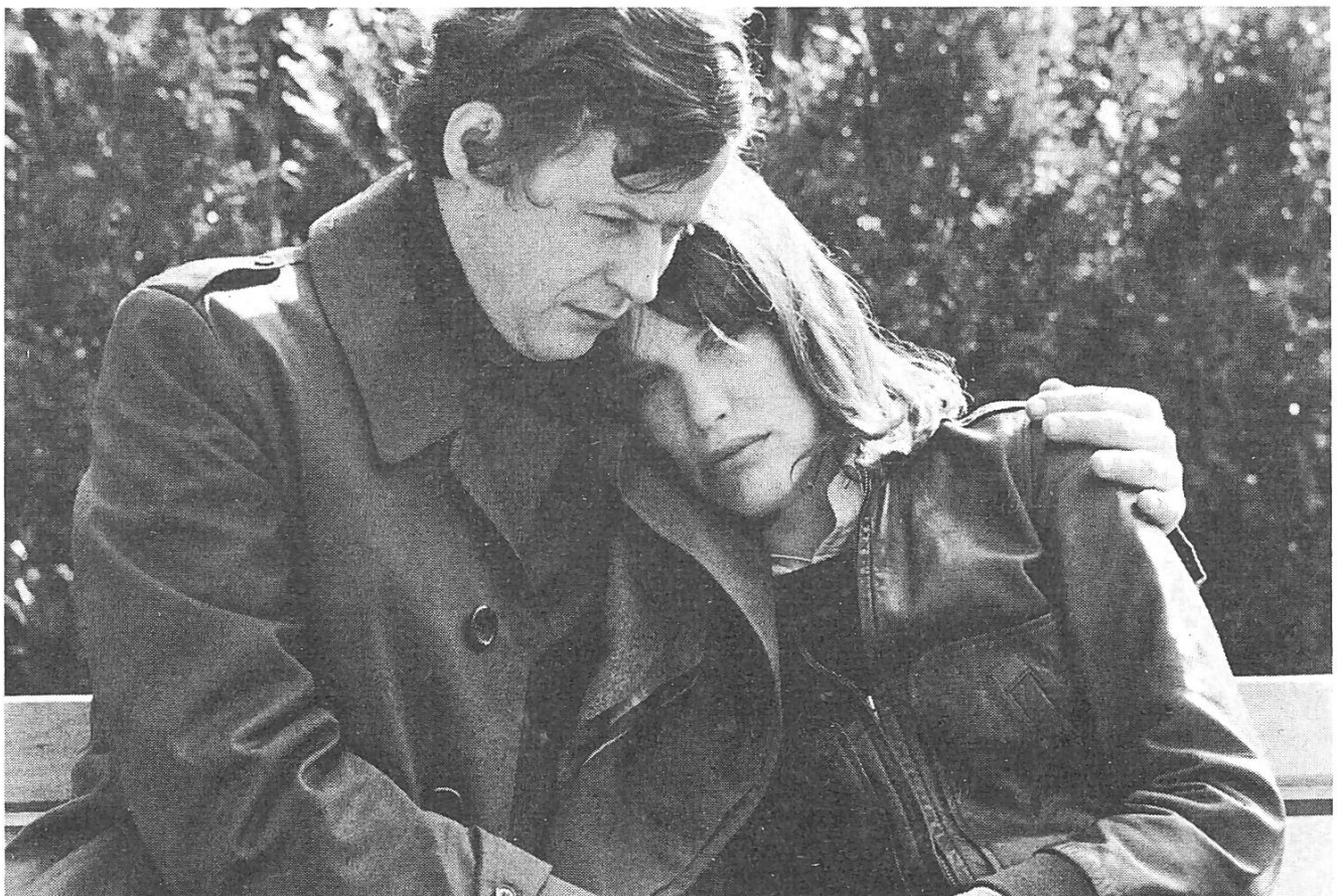
Bernard Verley und Zouzou in Eric Rohmers «L'amour, l'après-midi»