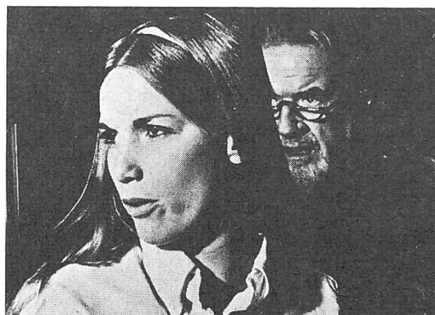
Szene aus «The Visitors» von Elia Kazan