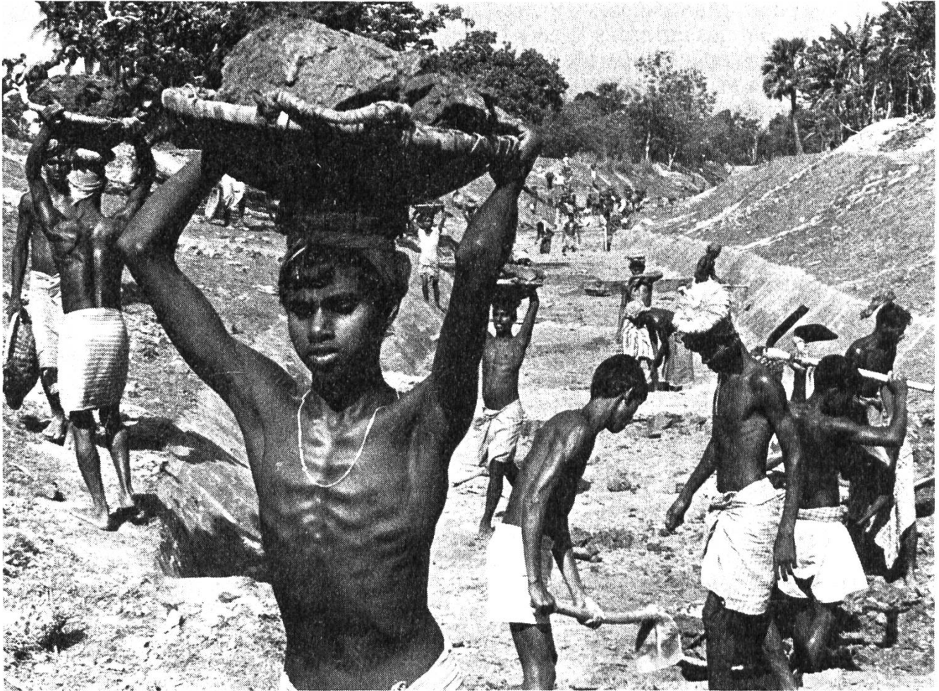
«Allahr Itscha» von Karl Gähwyler.

Film will eine aktuelle Bestandesaufnahme zur raschen Orientierung sein, und dieser Zweck wird voll erreicht. Nicht zuletzt ist «Allahr Itscha» ein eindrücklicher, überzeugender Rechenschaftsbericht über die Verwendung kirchlicher Hilfsgelder, mit deren Hilfe in einer Welt dunkler Not immerhin ein kleiner Hoffnungsschimmer leuchtet.