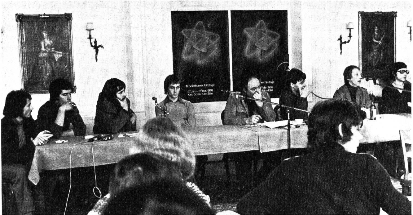
Pressekonferenz im Hotel Krone

sich eine solch wichtige Thematik durchaus verfilmen lässt, nur müsste dies mit einem klaren Filmkonzept klar zum Ausdruck gebracht werden. Das heisst nun aber nicht, dass der Film keine Qualitäten hat. Denn er darf für die sozialpädagogische Ausbildung als wertvolles Hilfsmittel betrachtet werden. Christian Murer