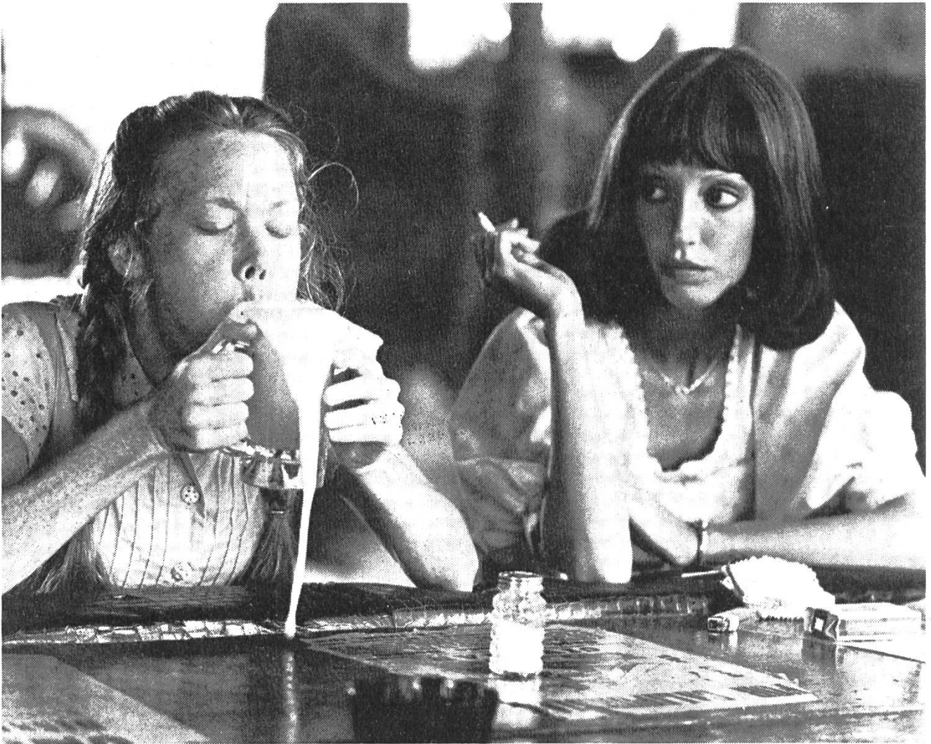
Das Porträt von drei Frauen (im Bild: Sissy Spacek und Shelley Duval) zeichnet Robert Altman in «Three Woman».

senschaftlichen Strukturen durchgerungen, die zu einer Anhebung des bescheidenen Lebensstandards dienen sollen. Mit Hilfe des Staates soll auch der Bau von menschenwürdigen Wohnungen vorangetrieben werden, die der individualistischen Lebensweise der Familien entsprechen. Der Film schenkt in erregender Weise jenen das Wort, die mit der Erneuerung Hoffnungen verbinden, aber gibt es auch jenen, die weiterhin lieber auf ihre eigene Kraft vertrauen, die glauben, dass sie alleine weiter kommen. Dadurch wird Erneuerung als ein komplexer Prozess durchschaubar gemacht.